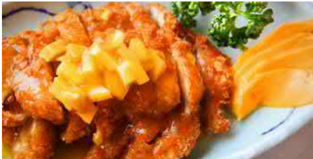
801. PANIERTES POULET AN MANGOSAUCE 25 芒果鸡

alle unsere hauseigenen Spezialitäten werden mit frischen Zutaten und mit grösster Sorgfalt zubereitet. Unsere Spezialitäten stehen für harmonische Aromakombinationen und sind echte Gaumenfreuden.