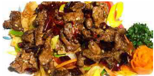
804. RINDFLEISCH MONGOL.ART MIT KÜMMEL 30 孜然牛肉 🌶️