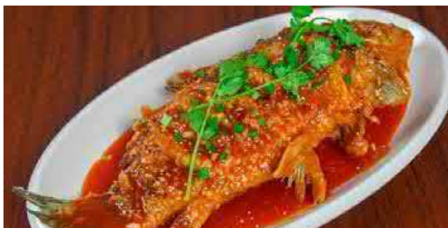
806. GANZER, GESCHMORTER FISCH 红烧全鱼