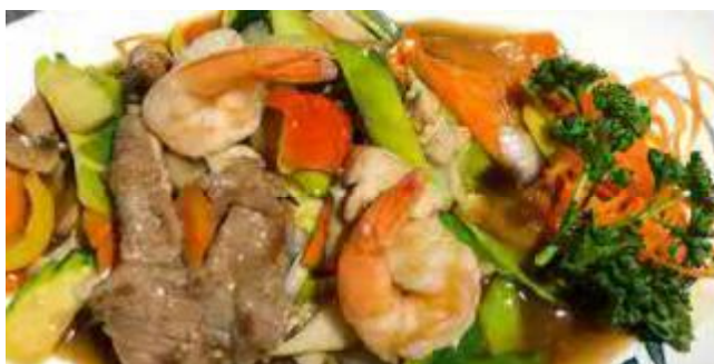
808. GLÜCK FÜR DIE FAMILIE 全家福 (3 Sorten Fleisch, Crevetten Chop Suey Style)