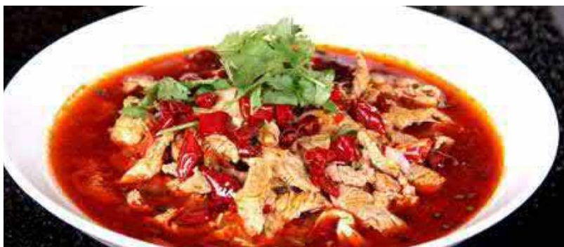
805. GEKOCHTES RINDFLEISCH AN CHILI OEL 35 水煮牛 🌶️