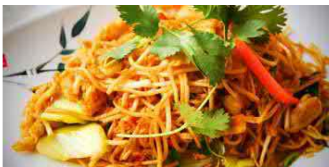
810. MAH MEH NUDELN MIT POULET (GELB. CURRY)