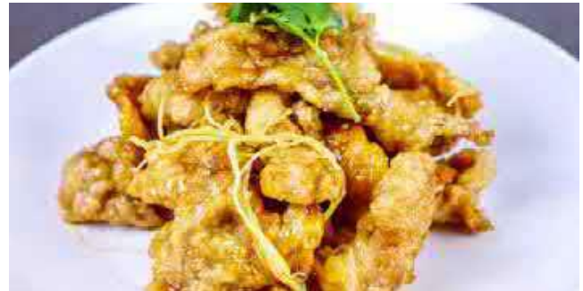
802. GEBRATENES SCHWEINEFLEISCH IM TOPF 27 锅包肉