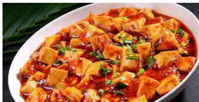
809. MAPO TOFU (MIT RINDERHACK) 麻婆豆腐