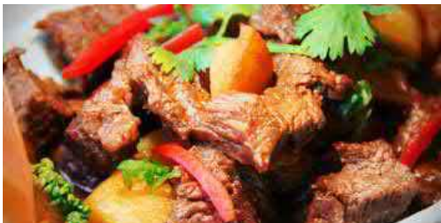
803. RINDFLEISCH AN BRATENSAUCE 32 红烧牛肉 🌶️