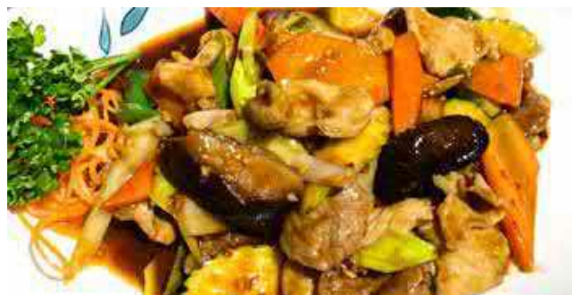
807. ACHT CHINESISCHE KOSTBARKEITEN 八宝辣酱 (3 Sorten Fleisch, Gemüse, scharfe Sauce)