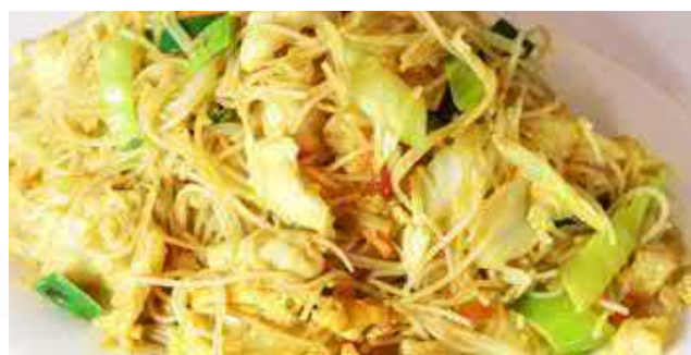
811. SINGAPORE NUDELN, CREVETTEN (GELB. CURRY)